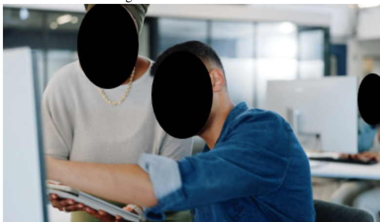
Figura 2. Pessoas no escritorio